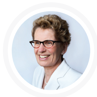
Kathleen Wynne Premier